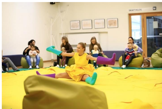
Šokio teatro „Dansema“ spektaklis kūdikiams, 2022-11-08

finansuotų projektų lėšomis. Daugiausia renginių (projektų baigiamieji renginiai, kūrybinės dirbtuvės, seminaras „Kaip padėti senjorams integruotis į visuomenę, motyvuoti ir įgalinti veikti?“, jaunimo verslumo skatinimo vasaros stovykla, verslo ir inovacijų mokykla jaunimui, patirčių mainų stovykla senjorams „Mobilus senjoras“ ir kt.) surengta vykdant Europos sąjungos struktūrinių fondų ir Marijampolės savivaldybės finansuotus projektus „Bendradarbiavimas integruojant socialinę atskirtį patiriančius vaikus ir paauglius“ ir „Sidabrinis amžius: socialinė integracija per švietimą abipus sienos“. Paminėtini projekto „Baroko puota su grafiene Butleriene“ renginiai: istorinės paskaitos „XVII a. pab. XVIII a. pr. dvaro kasdienybės, gyvenimo būdo ir pokylių kultūra“, „Barokas (XVIII a.) – kostiumo istorija“, ryškūs teatralizuoti istorinio kostiumo parodos pristatymai, Marijampolės 230-ies metų sukakčiai paminėti buvo skirtas festivalis Viešojoje bibliotekoje „Reali virtualybė. Greitis 230“ (7 renginiai, 702 dalyviai). Tęstinis projektas „Rudens romantika bibliotekoje. Žiemos etiudai“, suteikė galimybę dalyvauti edukaciniuose užsiėmimuose, susitikti su kūrėjais ir atlikėjais.