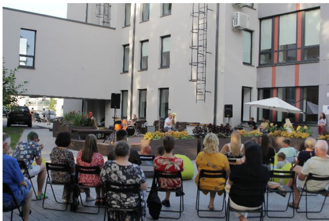
Jaunųjų Marijampolės atlikėjų koncertas, 2022-08-18

Viešojoje bibliotekoje buvo surengta 175, padaliniuose –185 renginiai. Kaimo padaliniuose į renginių apskaitą nebuvo įtraukti maži vaizdiniai renginiai. Renginiuose dalyvavo daugiau kaip 14, 8 tūkst. arba 27, 2 proc. savivaldybės gyventojų, iš jų 3, 5 tūkst. vaikai iki 14 m. amžiaus. Renginiais buvo paminėtos LR Seimo paskelbtos atmintinos datos, Nacionalinė Lietuvos bibliotekų savaitė, Šiaurės šalių bibliotekų savaitė, Sūduvos metai, Magdeburgo teisių suteikimo Marijampolės miestui sukaktis, Gyvūnų gerovės metai, kalendorinės šventės, rašytojų jubiliejai ir kitos datos, svarbios bendruomenei. Dauguma renginių surengta pasinaudojus ES, LR Kultūros tarybos ir Marijampolės savivaldybės