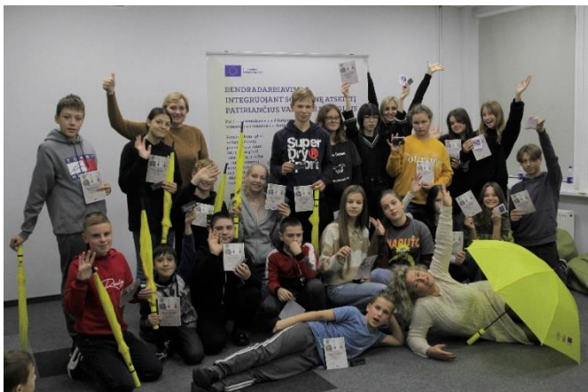
Verslo ir inovacijų stovyklos užsiėmimas jaunimui, 2022-11-05

Biblioteka 2022 metais vykdė 12 projektų. Lietuvos Kultūros taryba ir Marijampolės savivaldybės programos projektų finansavimui skyrė 30, 0 tūkst. Eur. Įgyvendinant projektus, didėjo bibliotekos paslaugų įvairovė ir prieinamumas visai Marijampolės bendruomenei: buvo gerinama Bibliotekos infrastruktūra,